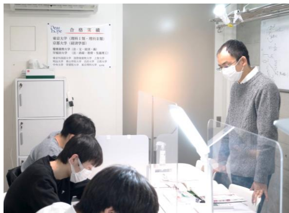
個別 (1対2) (奥の2席)