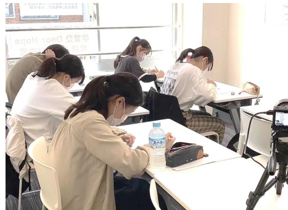
少人数グループ③ (新教室)